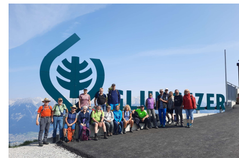
Wanderung Zirbenweg 2023