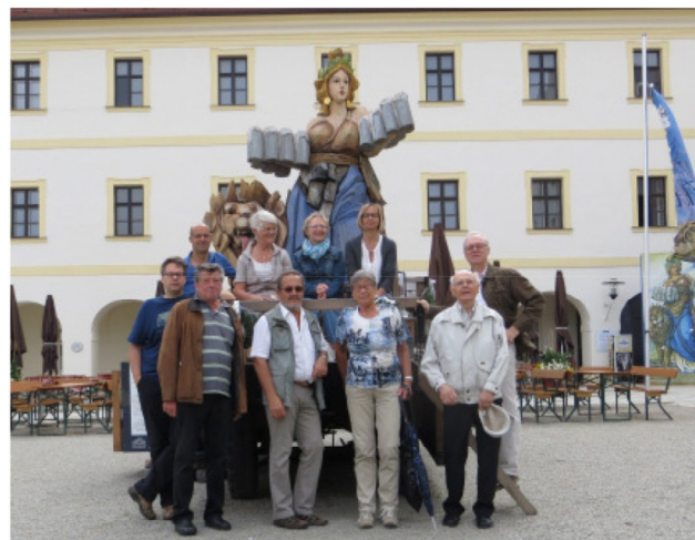
Ausstellung Bier in Bayern in Aldersbach